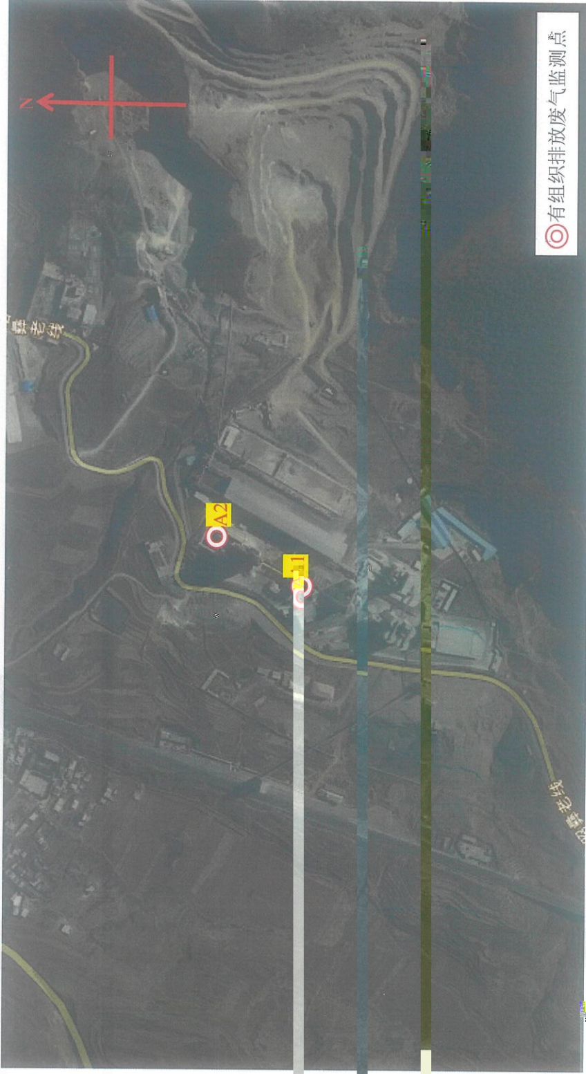
华新水泥（昭通）有限公司 2022 年第二季度比对监测点位图